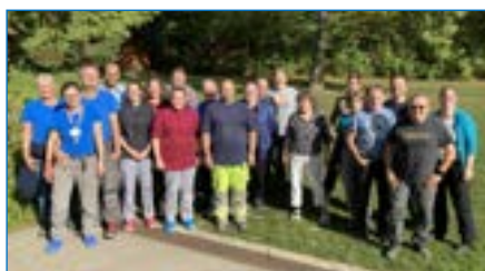
Team Arbeitswochenende 2023

In den Jahren etabliert sich ein Frühjahrs- und ein Herbst-Arbeitswochenende, eine Teamklausur zu Jahresbeginn und ein Team-Sommerfest!