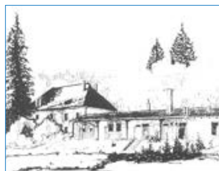
Bild unten: Haus und Herberge 1982 gezeichnet von Charly Wittmann

Um das BZW bekannter zu machen, werden 1984 erstmals ein Prospekt und eine Ansichtskarte aufgelegt.