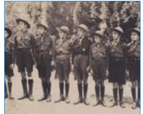
Linzer Fuchspatrolle 1923

Daneben entwickelten sich weitere katholische Pfadfindergruppen im „Reichsbund der katholisch deutschen Jugend“, im Elternverein „Frohe Kindheit“ und unabhängige „Pfadfinderkorps St. Georg“ in Oberösterreich und der Steiermark.